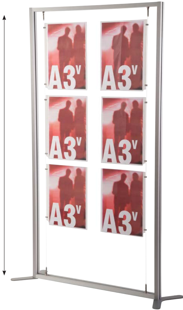
Fissaggio su cavetto