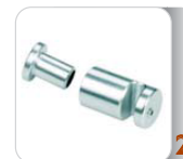
Aggancio a barra