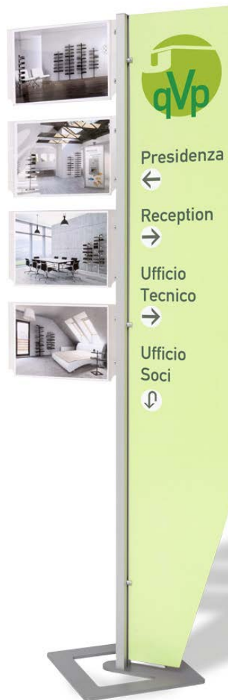
Mini totem InUno Quadro