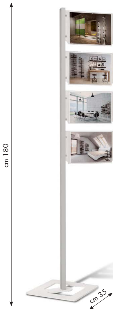
Mini totem InUno 4x4